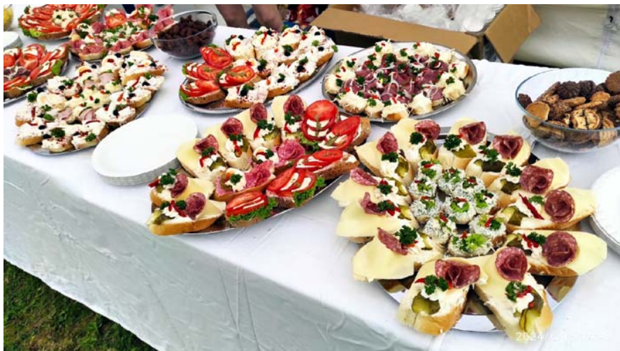
A ke každé oslavě patří také malé pohostění...