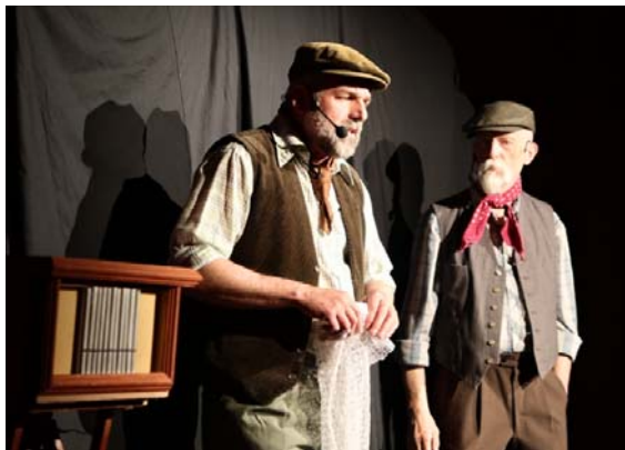
Inscenace Tři čuníci souboru Před Branou Rakovník